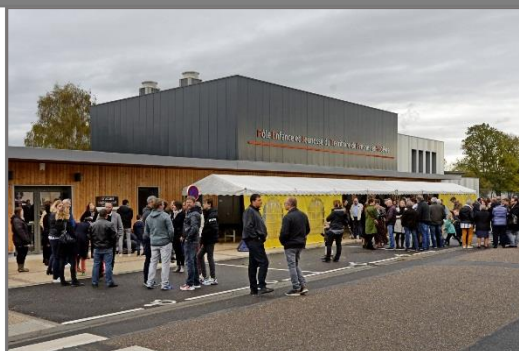
Pôle Enfance Jeunesse de Fresnes en Woivre

100 % d'objectif atteint pour le volet mobilité.